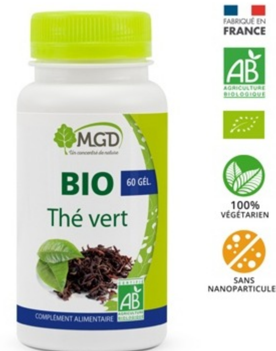
Thé vert bio 60 gélules - 1 BIOGTHE

INSCRIVEZ-VOUS À NOTRE NEWSLETTER ET SUIVEZ-NOUS !