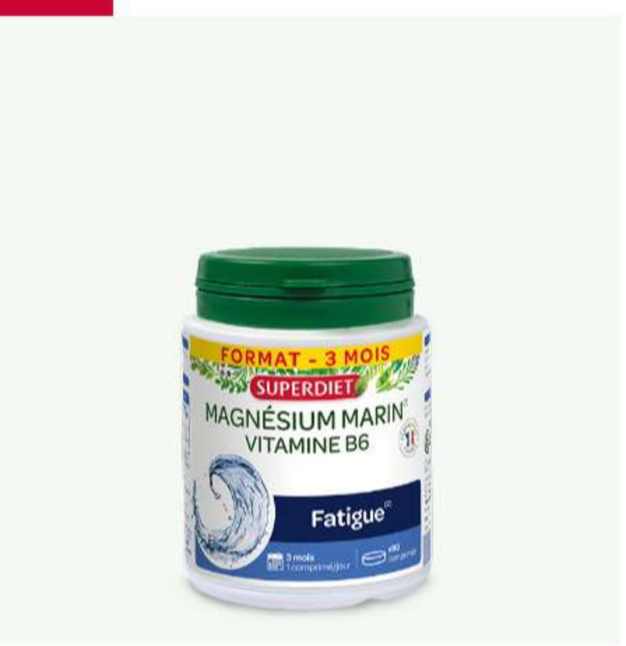
MAGNESIUM MARIN + VITAMINE B6 Vitalité, tonus & stimulants