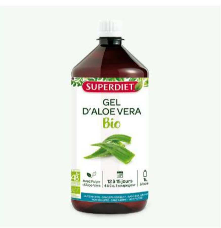
GEL D'ALOE VERA BIO Autres spécialités