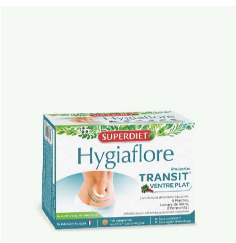
HYGIAFLORE RHUBARBE TRANSIT Transit & digestion